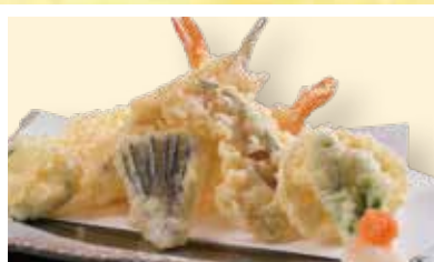
天ぷら盛合せ ミニ天ぷら盛り 680円