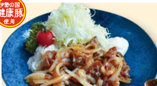
健康豚肩ロース肉 生姜焼き 930円