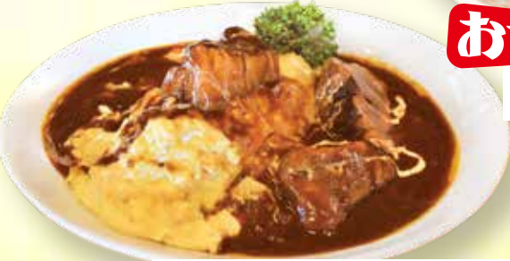
ビーフシチューオムライス 2,600円