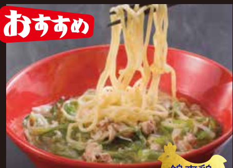
錦爽鶏の 鶏塩ラーメン 800円