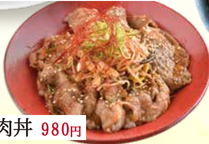
牛カルビ焼肉丼 980円