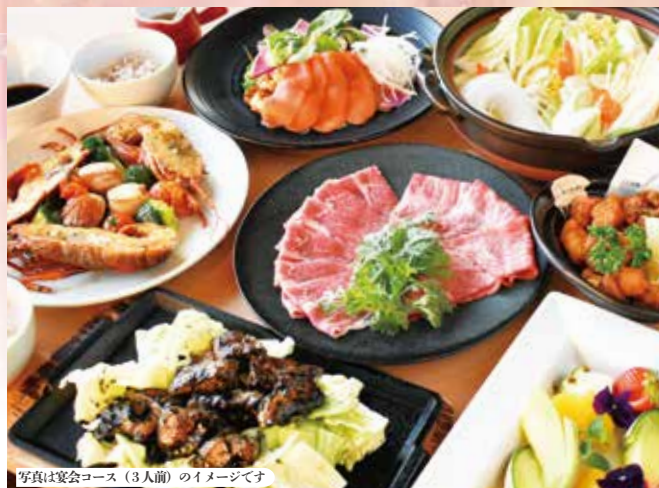
写真は宴会コース(3人前)のイメージです

要予約◆4名~12名様でご予約下さい◆12名様以上のご予約についてはご相談ください◆バス送迎相談。 遠方の送迎はお断りする場合がございます◆混雑状況により予約を受け出来ない場合がございます ◆季節により料理内容が変更となる場合がございます◆料理写真はイメージです◆泥酔状態での入浴利用は ご遠慮ください◆表示価格は税込みです