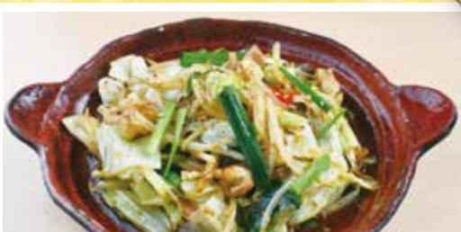
松阪牛ホルモン野菜炒め 980円