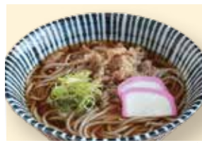
肉うどん・そば 各690円