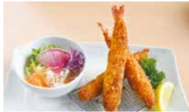
エビフライ ミニサラダ付き 1,180円