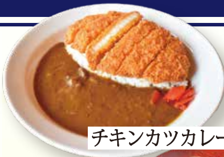
チキンカツカレー 1,060円