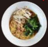
広島風辛つけ麺 810円